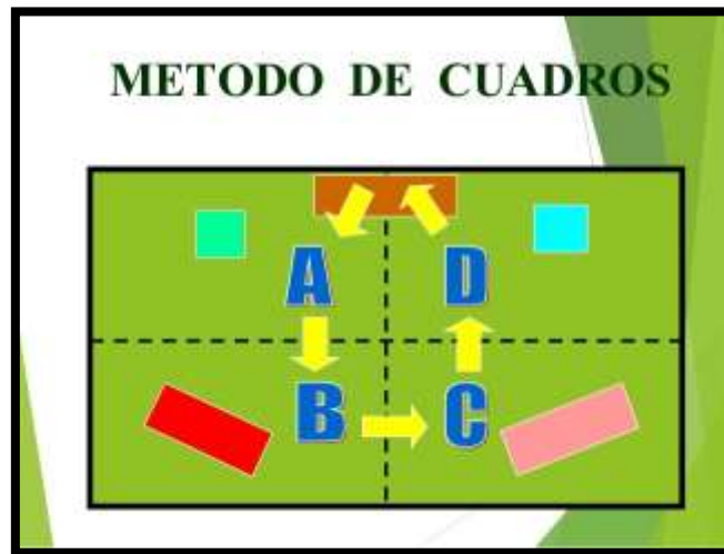
Esquematación del abordamiento de la escena del crimen por el método de cuadros