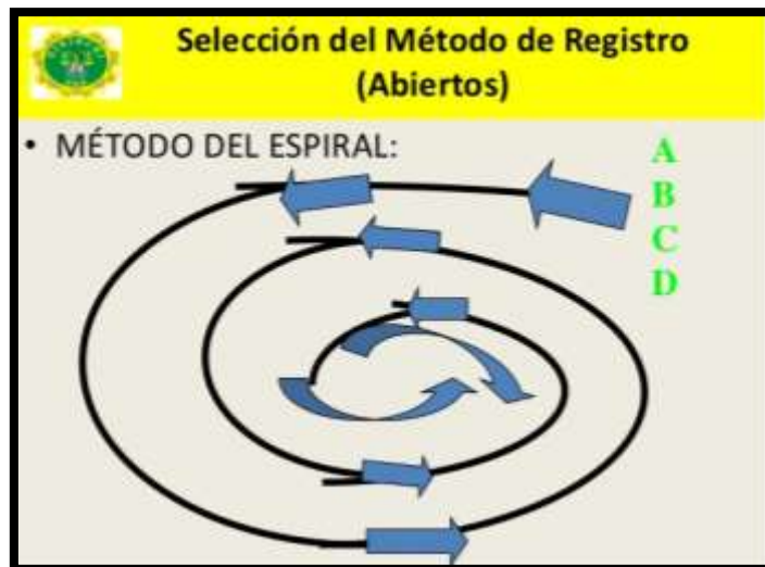
Esquematación del abordamiento de la escena del crimen por el método espiral