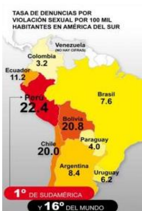
Imagen N° 01: Comparación de violaciones del Perú Respecto a otros países

evidencia la precariedad de la situación respecto a las violaciones sexuales (Mujica, 2011, p. 53),