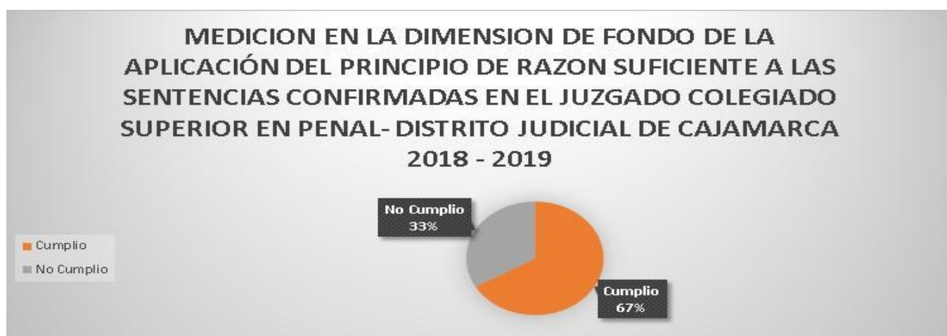
Figura 3: Medición en la dimensión de fondo de la aplicación del Principio de Razón Suficiente a las sentencias confirmadas en el juzgado Colegiado superior en el penal. Distrito Judicial de CAJAMARCA 2018 - 2019

Dentro de la dimensión de Fondo para la aplicación del Principio de Razón Suficiente, al evaluar nuestras sentencias muestra llegamos al siguiente resultado: